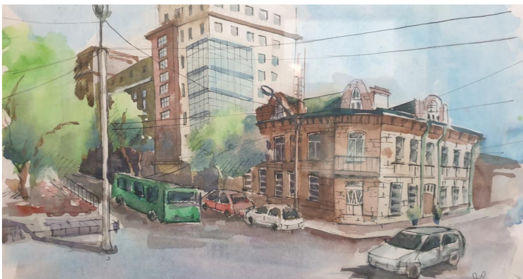
Рис. 2. Студенческая работа (НГУАДИ). Рук.: Самойлов В.В. Использование акварели и линеров [5].

Гибкость акварели проявлялась двояко. С одной стороны, работа могла быть завершена на любой стадии (рис. 1–3). С другой стороны, акварель могла органично «вытесняться» другими материалами (как правило, цветными маркерами). В этом случае работа приобретала «застылый» (законченный) характер: теряла свою эскизность, а также присущую ей изначально легкость и непосредствен-