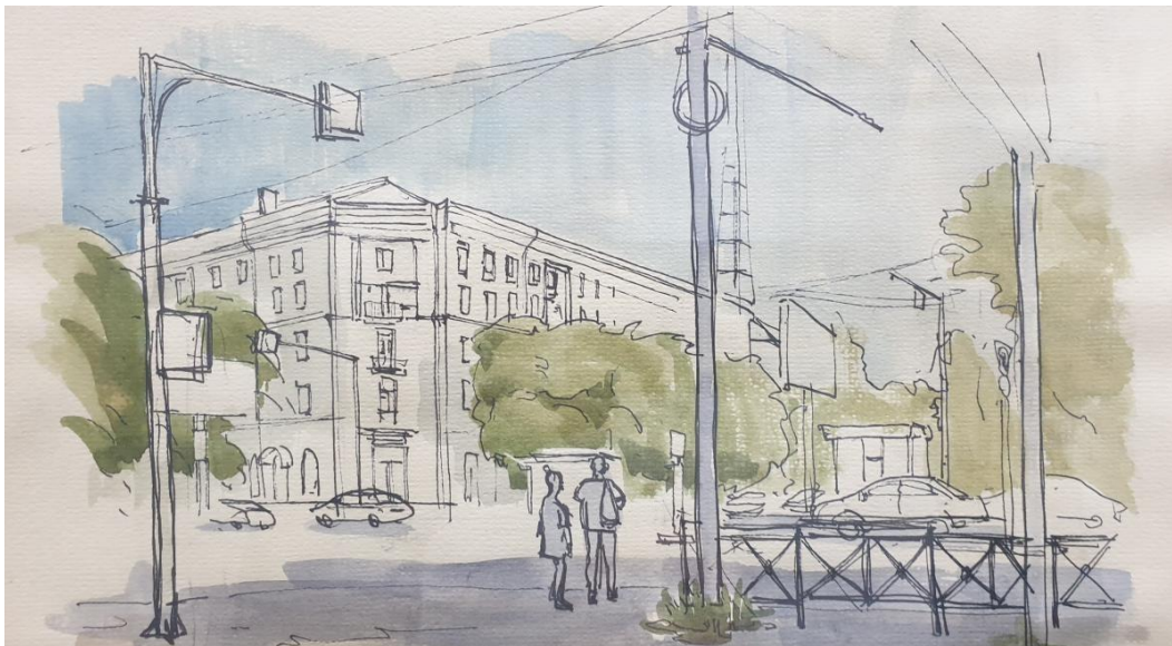
Рис. 1. Студенческая работа (НГУАДИ). Рук.: Самойлов В.В. Использование акварели и линеров [5].

Штрих является неотъемлемой частью любой зарисовки. Он усиливает эмоциональное воздействие любой картины, формирует материальную, осязаемую, поверхность и этим наполняет объем.